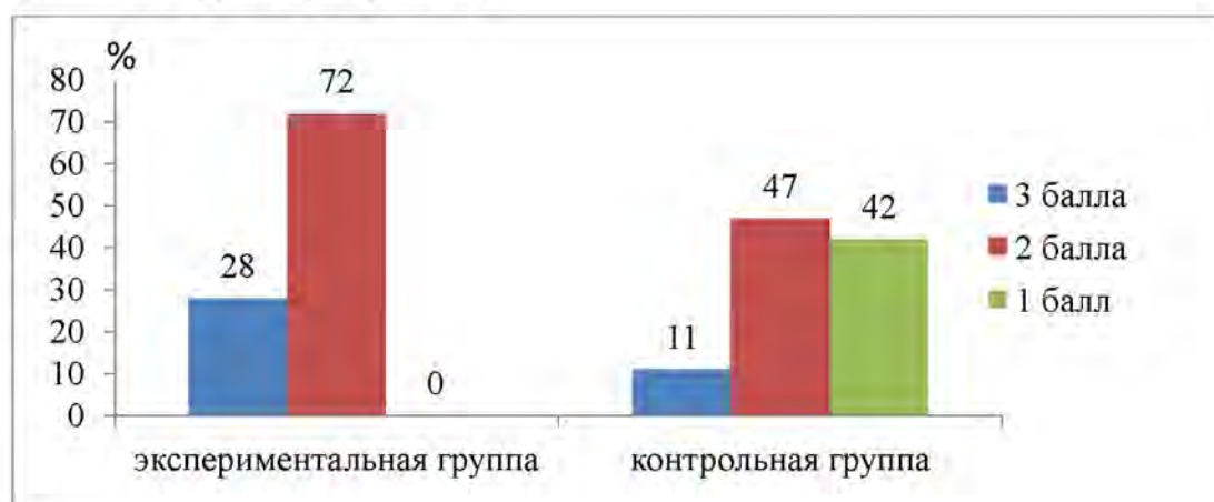
Рисунок 2 – Сравнительный анализ полученных баллов по итогам выполнения всех заданий детьми экспериментальной и контрольной групп исследования (контрольный эксперимент), %

Для проверки эффективности предлагаемой системы работы по развитию, обогащению и активизации словаря детей младшего дошкольного возраста в процессе ознакомления с природой была проведена повторная диагностика с целью выявления динамики в уровне развития словаря детей экспериментальной и контрольной групп (рисунок 2).